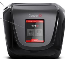
Display Touchscreen 2,4"

Na parte superior, à esquerda, encontra-se o botão responsável pela abertura da tampa e pelo acesso à cavidade onde será depositado o rolo de papel térmico a ser impresso.