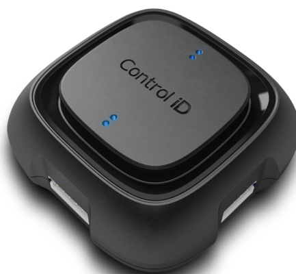
( Módulo de Acionamento )